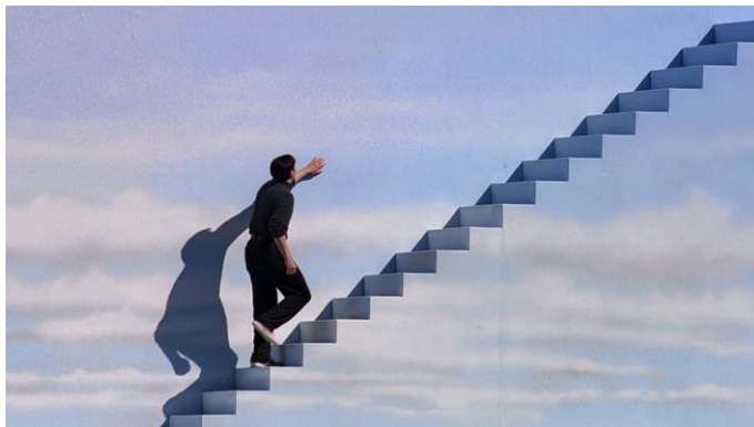
Fra filmen The Truman Show (1998, Peter Weir) Paramount Pictures.

Velkommen til filmvisninger i Sankt Jakobs Kirkes Sognegård, Østerbrogade 59. I denne sæson skal vi lidt rundt i Europa samt en smuttur til Japan, Israel og Kenya. Det stærke bånd mellem forældre og børn går igen i flere af sæsonens film, hvor mennesker i vidt forskellige situationer forsøger at finde mening og værdi i hverdagen.